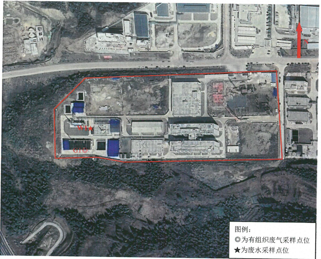
图 采样点位示意图