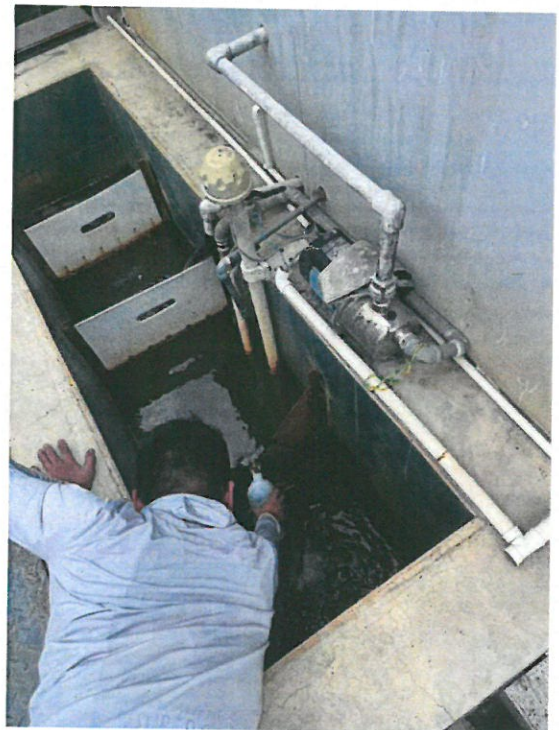
废水处理设施出口 W1