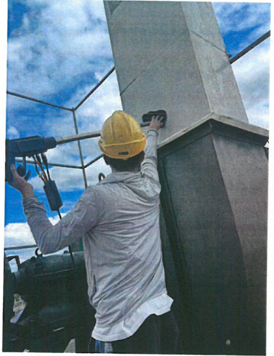
工艺有机废气排气筒出口(FQPK-0004)G4