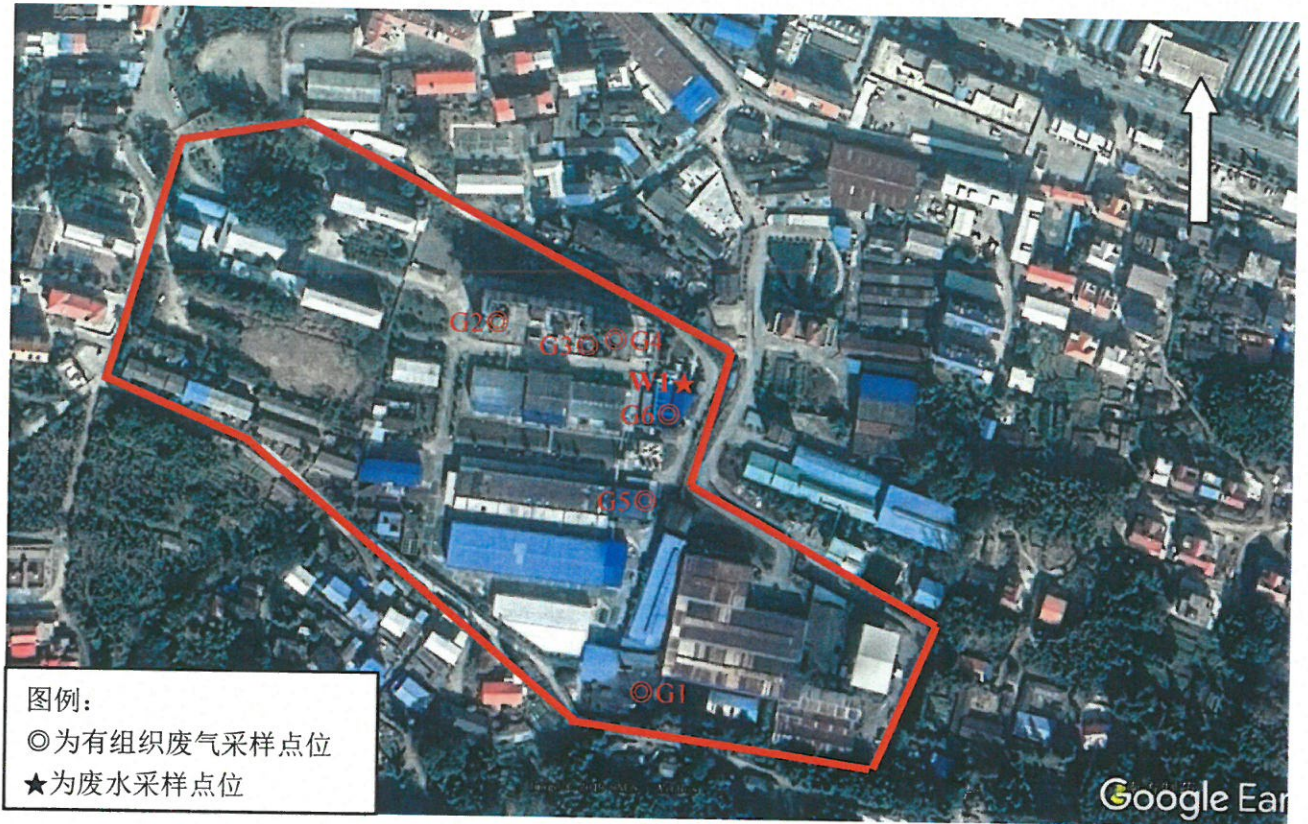
图 采样点位示意图