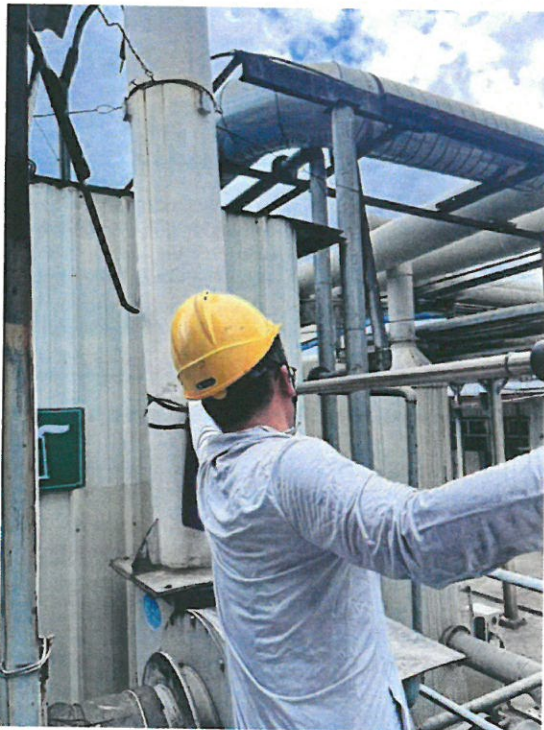
污水处理废气排气筒出口(FQPK-0006)G6